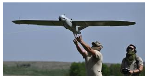
Figure 5 - Drône utilisé pour la guerre en Ukraine