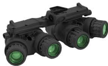
Figure 4 - Dispositif de vision nocturne