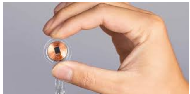
Figure 2 - Puce Neuralink par Elon Musk