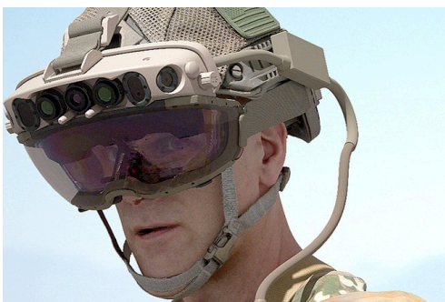
Figure 3 - Casque de réalité augmentée

Cette « phronesis technologique » suppose également de préserver l'autonomie de jugement des subordonnés, en veillant à ce que la technologie ne se substitue pas à la réflexion humaine. Le risque existe de voir l'autorité militaire évoluer en profondeur. Là où elle reposait traditionnellement sur la capacité à décider dans l'incertitude et à assumer le poids moral d'un ordre donné, elle pourrait demain être appréciée surtout à l'aune de la capacité à donner un sens humain à des systèmes techniques complexes. Le chef deviendrait alors moins un guide pour ses hommes qu'un simple gestionnaire de systèmes, au risque d'affaiblir le lien moral qui fonde la relation de commandement.